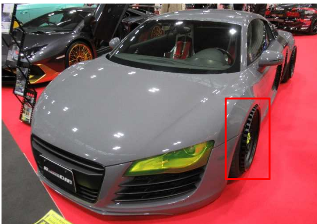
※タイヤ・ホイールの突出