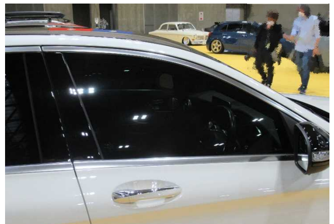
※運転席窓ガラスに着色フィルム